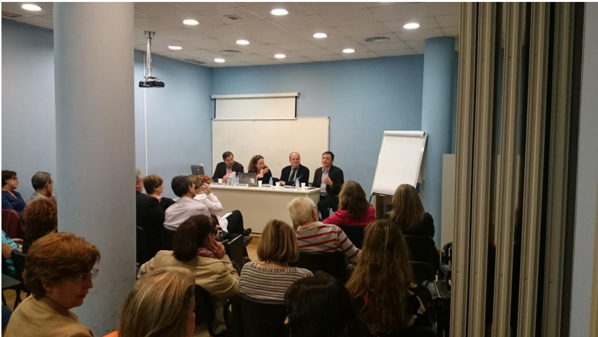
Vista del público asistente a la presentación del libro.